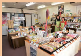
柳川の名産品がズラリと並ぶ「おいでメッセ柳川」