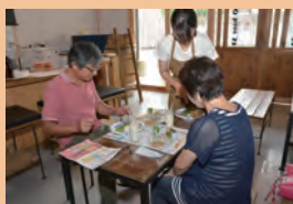
空き店舗を活用したフリースペース「KATARO base 32」